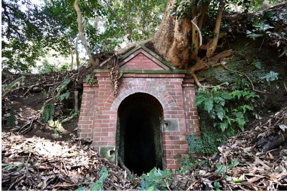
玄番井戸「竜の井」(前宿町)